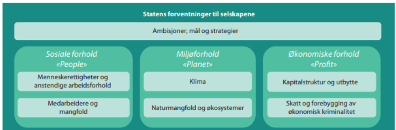
Figur 1 Statens forventningar til selskapa.

Gjennom eigarskapsmeldinga St.6 (2022-2023) stiller staten krav og forventningar til at verksemdar eigd av staten er leiande i arbeidet med ansvarleg verksemd. Staten sitt mål som eigar er at verksemdar i spesialisthelsetenesta har ei berekraftig drift og er mest mogleg effektiv i arbeidet med å oppnå helsepolitiske mål. Eigarskapsmeldinga inkluderer ambisjonar, mål og strategiar innan sosiale tilhøve, miljø og økonomi.