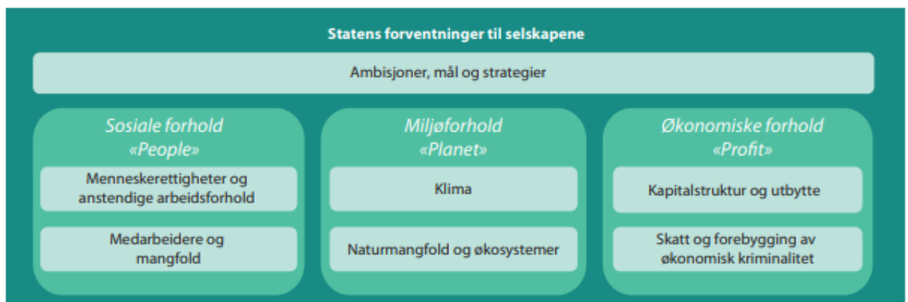
Figur 1 Statens forventningar til selskapa

Gjennom eigarskapsmeldinga St.6 (2022-2023) stiller staten krav og forventningar til at verksemder eigd av staten er leiande i arbeidet med ansvarleg verksemd. Staten sitt mål som eigar er at verksemder i spesialisthelsetenesta har ei bærekraftig drift og er mest mogleg effektiv i arbeidet med å oppnå helsepolitiske mål. Eigarskapsmeldinga inkluderer ambisjonar, mål og strategiar innan sosiale tilhøve, miljø og økonomi.